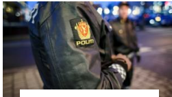
Politimann sparket av kvinne (43)