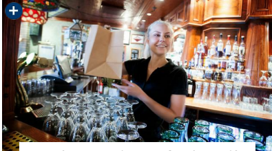
Ny kampanje oppfordrer til økt restepose-bruk