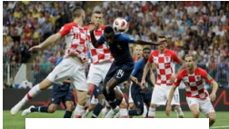
Selvmål, omstridt VAR-straffe og VM-tittel til Frankrike