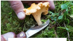
Biolog: – Tørken kan bli katastrofal for soppsesongen