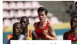
Ingebrigtsen håper EM blir et steg ned nivåmessig