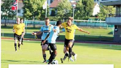
Sola-seieren glapp i sluttminuttene