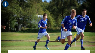
Madla-seier i Marvik-comeback