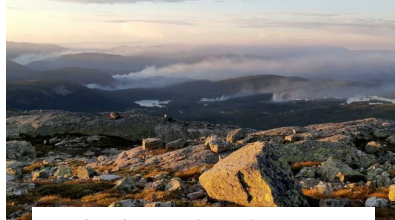
Skogbrannsituasjonen er bedret