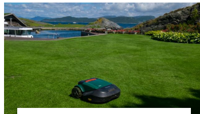
Insektekspert advarer mot robotgressklippere