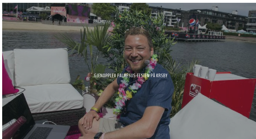
GJENOPPLEV PALMESUS-FESTEN PÅ KRSBY