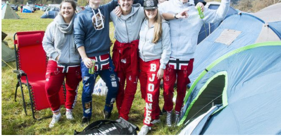
Agder og Rogaland-russen samlet til blåtur på Øyesletta i Kvinesdal 1. mai 2015.