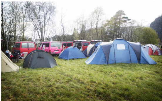
Agder og Rogaland-russen samlet til blåtur på Øyesletta i Kvinesdal 1. mai 2015.