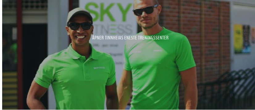
ÅPNER TINNHEIAS ENESTE TRENINGSENTER