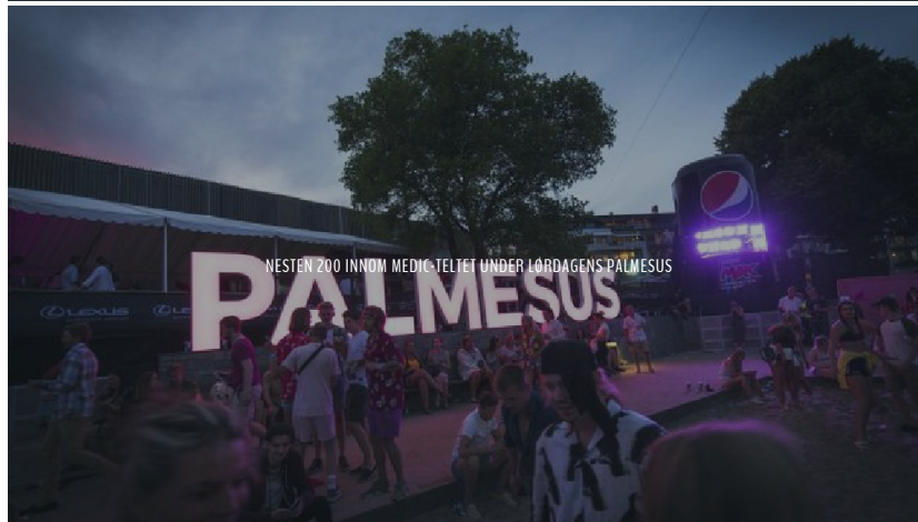
WESTEN ZOO INNMOM MEDIC-TELLET UNDER LØRDAGENS PALMESUS