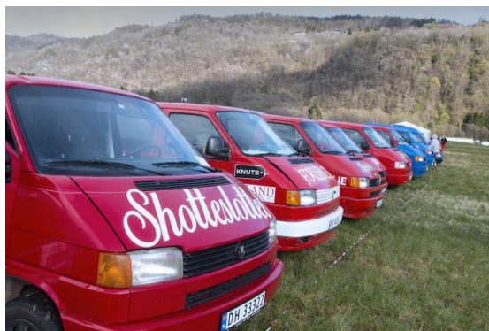
Russens Blåtur på Øyesletta i Kvinesdal 1. mai 2015.